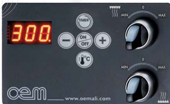
Pannello di controllo Control panel Panneau de contrôle Schaltfeld Panel de control